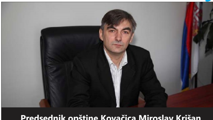
Predsednik opštine Kovačica Miroslav Krišan

U pitomoj ravnici na jugu Banata na površini od 419km 2 prostire se opština Kovačica, kao i lep i gostoljubiv istoimeni grad. Opština Kovačica se na jugu graniči sa područjem grada Pančeva, na istoku sa opštinom Alibunar, na severu sa opštinom Sečanj i područjem grada Zrenjanina, a na zapadu sa opštinom Opovo. Opština Kovačica ima 25.259 stanovnika, koji žive u osam naselja: Kovačica, Crepaja, Debeljača, Idvor, Padina, Putnikovo, Samoš i Uzdin. Kao i u prošlosti i danas Kovačica sa okolinom predstavlja multietničku sredinu međusobnog uvažavanja. Sastav stanovništva je višenacionalan. Uz poštovanje ljudskih prava, tradicije i različitosti bez obzira na versku, nacionalnu pripadnost, ovde žive građani srpske, slovačke, mađarske, rumunske i drugih nacionalnih pripadnosti. Zbog toga se za Kovačicu kaže da je ona „Vojvodina u malom“. Svako mesto u opštini ima nešto što ga ističe i odlikuje. Kovačica ima Galeriju naivne umetnosti i nazivaju je još metropolom svetske naive. Kovačica je našoj a i široj javnosti poznata pre svega po naivnom slikarstvu - ona je rodno mesto ove umetnosti, a iz nje su put sveta odaslate slike panonskih sela okupanih suncem u bojama bundeve, sa svojim čudesnim likovima i isto tako čudesnim perspektivama.